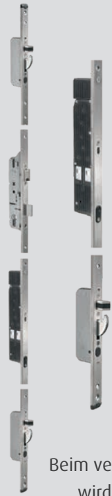
Beim verschließen des Mittenriegels wird der Fingerscanner blockiert.

Schaltnetzteil (Trafo) 230 Volt AC Eingang/12 Volt VDC Ausgang, Kabelanschlüsse 230 Volt im Blendrahmen montiert. Stößelkontakte zur Strom- und Datenübertragung im Blendrahmen montiert.