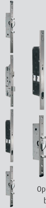
Optional mit integriertem Sperrbügelschloss aus Edelstahl zur Spaltöffnung des Flügels.